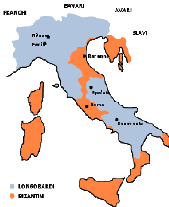
I domini dei longobardi nel VII secolo