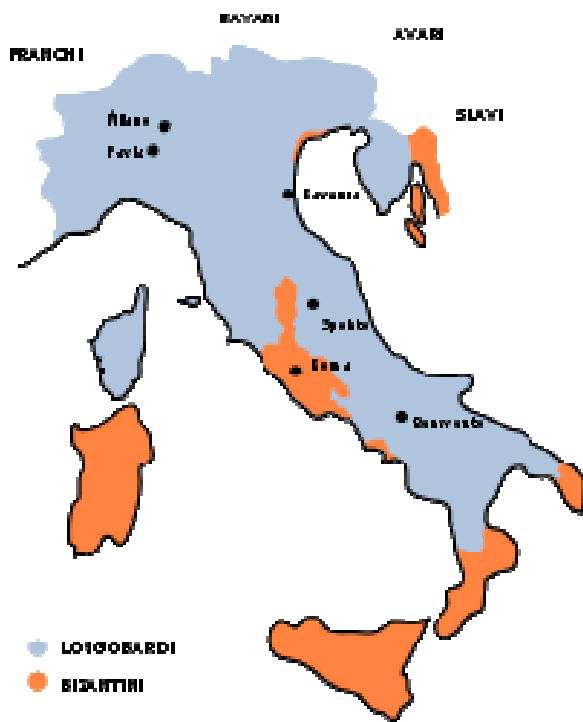
I domini dei longobardi nell' VIII secolo