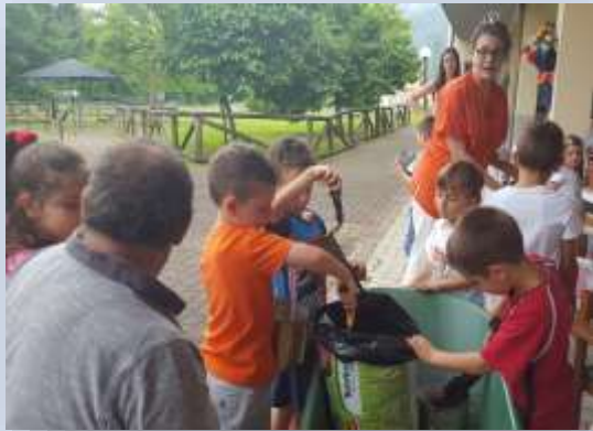
Prendiamo la terra.....